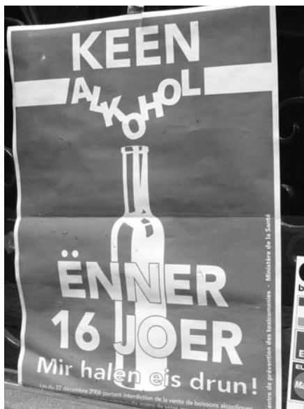
Deur van een supermarkt in Luxemburg