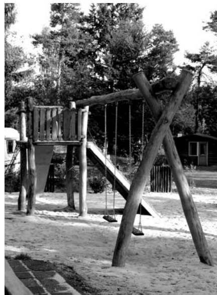
Gedeelte van het vernieuwde speeltuintje op het Spoek

Rest nog te vermelden dat de consumptieve verzorging van de nieuwjaarsbijeenkomst weer prima was, van de koffie en thee bij de aankomst via de erwtensoep in de pauze tot het drankje aan het einde.