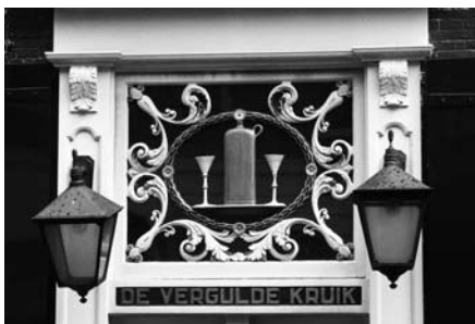
Ook vroeger werd er goed verdiend aan alcohol