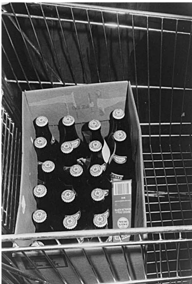
Boodschappen : 17 flesjes bier en 1 pak melk

In de tweede helft van de negentiende eeuw kende Nederland een enorm alcoholprobleem. In de eerste helft van de twintigste eeuw gelukte het om het niveau van de hoofdelijke consumptie, en de omvang van de problemen sterk terug te brengen. Na 1955 namen consumptie en problemen echter weer toe. In dertig jaar tijd steeg het hoofdelijk alcoholgebruik in ons land met ruim 300 procent. Daarvoor valt een aantal oorzaken aan te wijzen. Welvaart en vrije tijd namen toe, uitheemse drinkgewoonten werden door toeristen mee naar huis genomen, de alcoholreclame werd intensiever en effectiever, de medicalisering van het alcoholisme benam het publiek het zicht op het probleem, en de herinnering aan de ellende van vóór 1900 vervaagde. De toename van de vraag leidde tot een toename van het aantal verkooppunten, alcohol raakte op bijna elke straathoek verkrijgbaar.